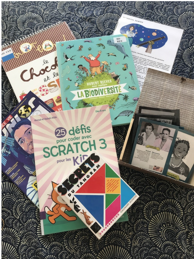
Sac 4 : BD Hubert Reeves explique la biodiversité ; 25 défis pour coder avec Scratch; Le chocolat et les desserts ; Sciences et Vie Junior 379 ; Secrets de tangram ; Bio Henriette Leavitt ; Jeu Femmes de sciences