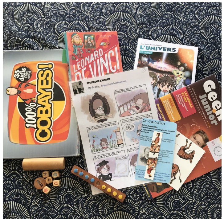
Sac 7 : 100 % cobayes ; Léonard de Vinci vu par une ado ; L'univers en manga ; Geek Junior 009 ; Comicsciences Stephanie Kwolek ; Poker Dice ; Enigme des grenouilles