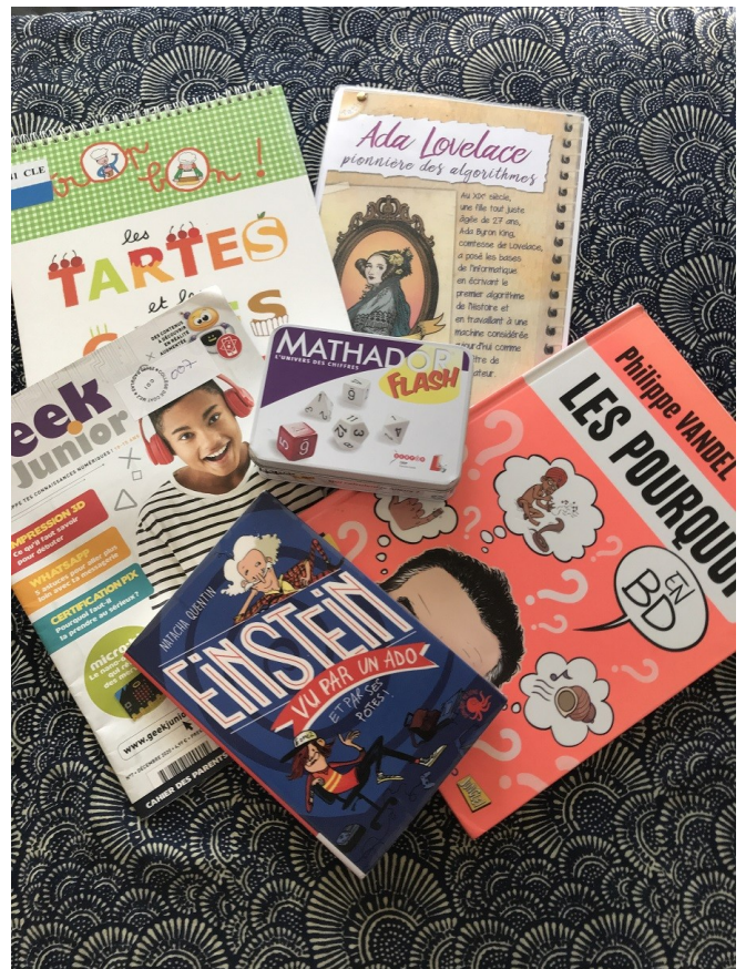
Sac 5 : Les pourquoi en BD ; Geek Junior 007 ; Tartes et cakes ; Einstein vu par un ado ; Mathador Flash ; Pyramide à reconstituer ; Bio Ada Lovelace