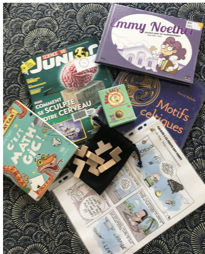
Sac 1 : BD Emmy Noether ; C'est math'gic ! ; Motifs celtiques ; Sciences et Vie Junior n°377 ; Numécats ; Comicsciences : Galilée et la chute des corps ; Le cube à reconstituer