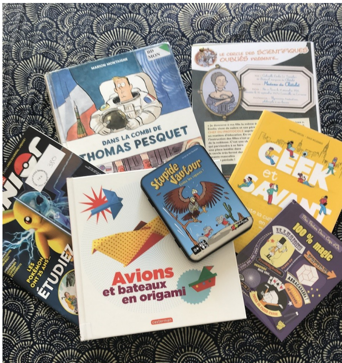
Sac 6 : BD Dans la combi de Thomas Pesquet ; Sciences et Vie Junior 380 ; Avions et bateaux en origami ; Geek et Savant ; Stupide vautour ; 100 % magie ; Bio Emilie du Châtelet